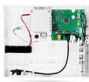
JA-103KR KIT Πίνακας ελέγχου συναγερμού JA-100+