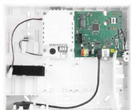
JA-103K Πίνακας ελέγχου συναγερμού JA-100+