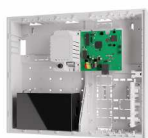
JA-103K - 7AH Πίνακας ελέγχου συναγερμού JA-100+