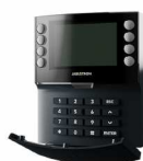
JA-115E-AN Πληκτρολόγιο bus ανθρακί χρώματος