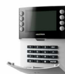
JA-115E Πληκτρολόγιο bus λευκού χρώματος