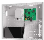
JA-103K - 7AH Πίνακας ελέγχου συναγερμού JA-100+